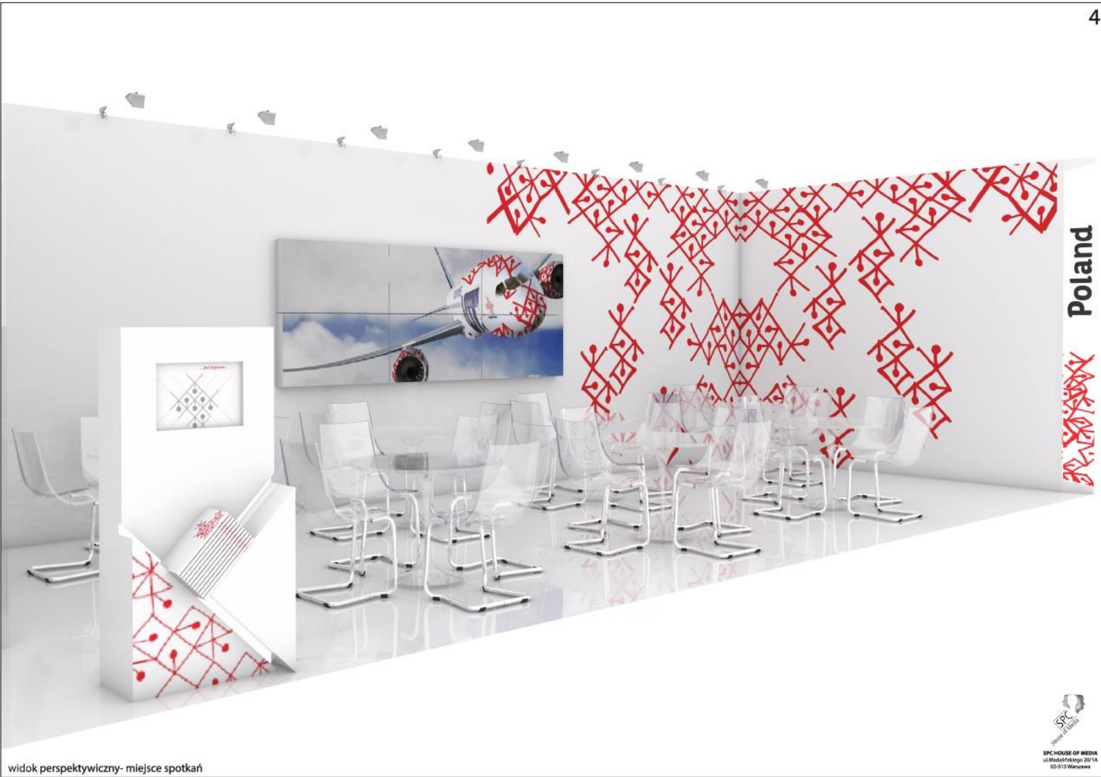
widok perspektywiczny- miejsce spotkań