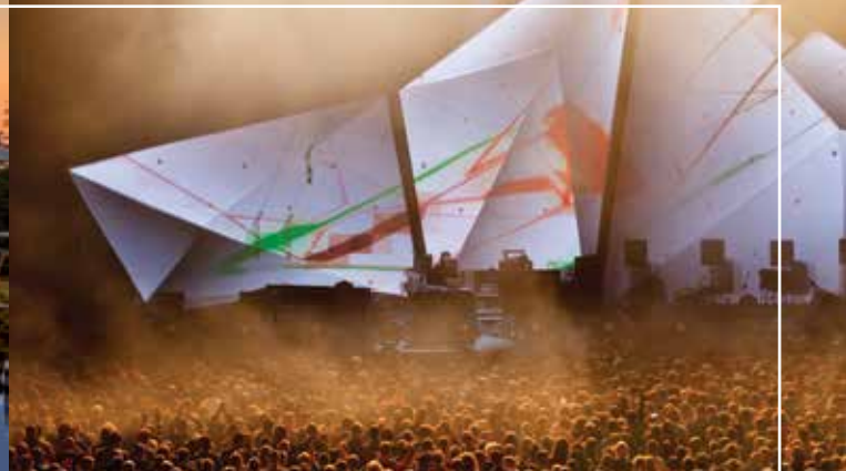
Sacrum Profanum Festival.

Рекомендуємо вам відвідати наше місто і при нагоді скористатися послугами наших відомих центрів . Ви можете зв'язатися з ними безпосередньо, хоча в столиці Малопольщі також достатньо компаній і туристичних бюро, які забезпечують комплексне обслуговування медичних туристів. Варто скористатися їхньою допомогою.